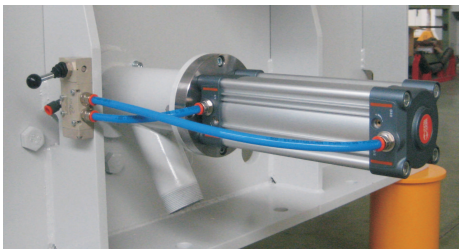
TOMA MUESTRAS NEUMÁTICO